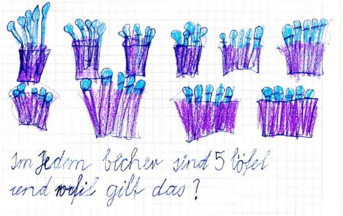
Bild: 2. Schuljahr Klasse Beatrice Heilig und Regula Lehmann, Schulhaus Pestalozzi Rorschach