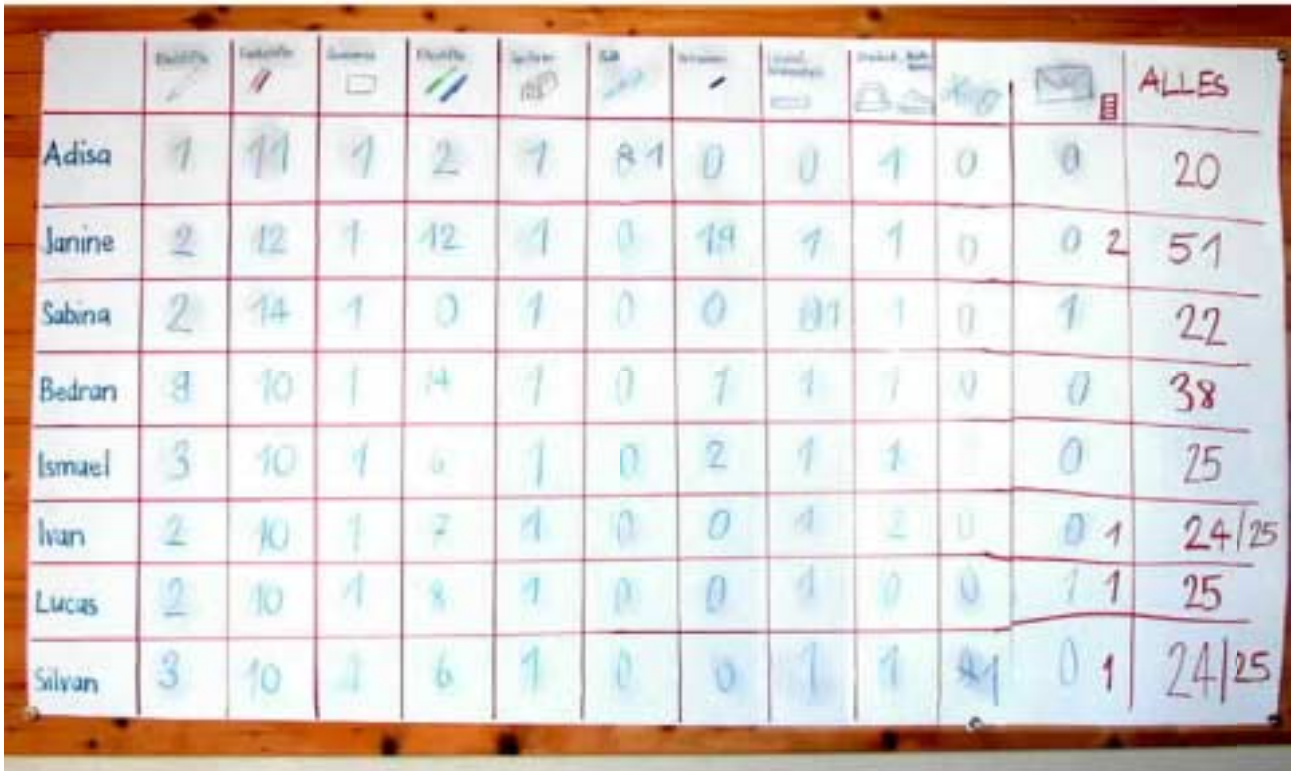
Tabelle mit der Übersicht über die Sachen im Etui - und der Gesamtzahl.